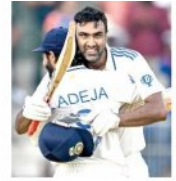
ଅଶ୍ୱିନ-ଭାଡ଼ୁକା ଲଢ଼ିଲେ; ଭାରତ ୬/୩୩୯