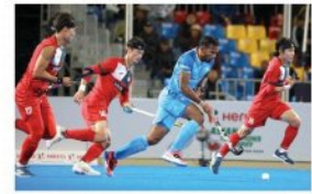
ଏସିଆନ୍ ଚମ୍ପିୟନ୍ସ ଟ୍ରଫି ହକି ପାଇନାଲ: ଆଜି ଚୀନକୁ ଭେଟିବ ଅପ୍ରତିଦ୍ୱନ୍ଦ୍ୱୀ ଭାରତ