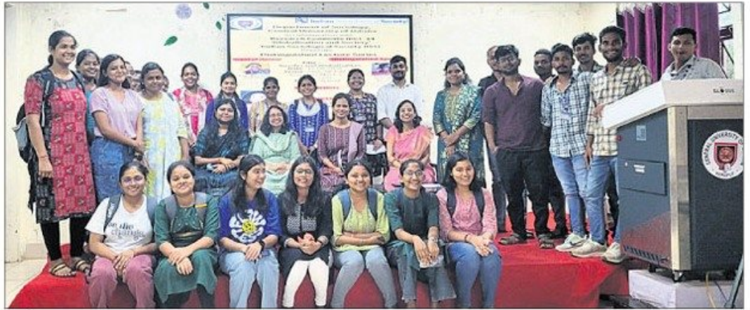
କାର୍ଯ୍ୟକ୍ରମରେ ଶିକ୍ଷାବିତ୍, ଛାତ୍ରାଛାତ୍ରୀ ଓ ଅନ୍ୟମାନେ ।