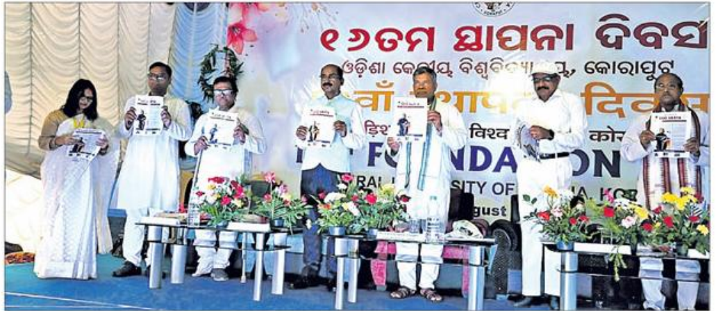
ଓଡ଼ିଶା କେନ୍ଦ୍ରୀୟ ବିଶ୍ୱବିଦ୍ୟାଳୟ ପକ୍ଷରୁ ୧୬ତମ ପ୍ରତିଷ୍ଠା ଦିବସ ଅବସରରେ ପୁସ୍ତିକା ଉନ୍ମୋଚନ କରାଯାଇଛି ।