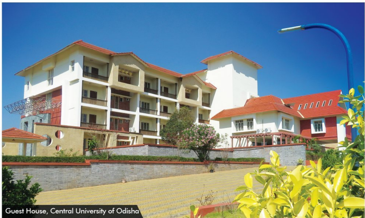
Guest House, Central University of Odisha