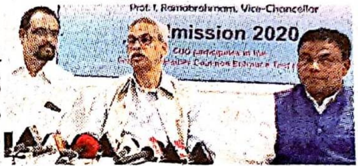
మాట్లాడుతున్న వైస్ చాన్సలర్ రామబ్రహ్మం

విజయవాడ, ఫిబ్రవరి 17 (ఆంధ్ర జ్యోతి) : ఒడిశాలోని కోరాపుట్లో ఉన్న కేంద్రీయ విశ్వవిద్యాలయంలో 2020 విద్యా సంవత్సరానికి పోస్ట్ గ్రాడ్యుయేషన్, ఎంఫిల్, పీహెచ్డీ కోర్సుల్లో ప్రవేశాలకు దరఖాస్తులను ఆహ్వానిస్తున్నట్లు ఆ యూనివర్సిటీ వైఎస్ చాన్సలర్ రామబ్రహ్మం తెలిపారు. తెలుగు విద్యార్థులు ఒడిశాలో మంచి కోర్సులు