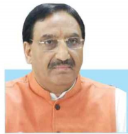
କେନ୍ଦ୍ର ଶିକ୍ଷାମନ୍ତ୍ରୀ ଏମ୍.ଭି. ଲାଲ୍ (ପୃଷ୍ଠା:୨)