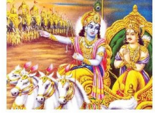
ଯେଉଁ ମୁହୂର୍ତ୍ତ ମନୁଷ୍ୟ କର୍ମେନ୍ଦ୍ରିୟମାନଙ୍କୁ ବଳପୂର୍ବକ ରୁଦ୍ଧ କରିଦେଇ ମନ ଦ୍ୱାରା ସେହି ଇନ୍ଦ୍ରିୟମାନଙ୍କର ବିଷୟ ଚିନ୍ତା ବହୁଥାଏ, ତାହାକୁ ମିଥ୍ୟାଚାରା ବୋଲି କୁହାଯାଏ ।